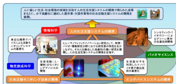
ヒューマノフィリックイノベーション科学技術推進事業の概念図

生体活動のモニタリング技術と人体・環境への負荷軽減素材を活用した新たな生活支援システムの開発に向けた研究を行う「 ヒューマノフィリックイノベーション科学技術推進事業 」では、人・植物等の生体活動のモニタリングを可能とする新たなデバイスの開発、宅内行動認証手法の拡張によるコンテキストウェアシステムの構築、バイオ分子を利用したバイオナノ素子やグリーン素材の創出を進め、科学