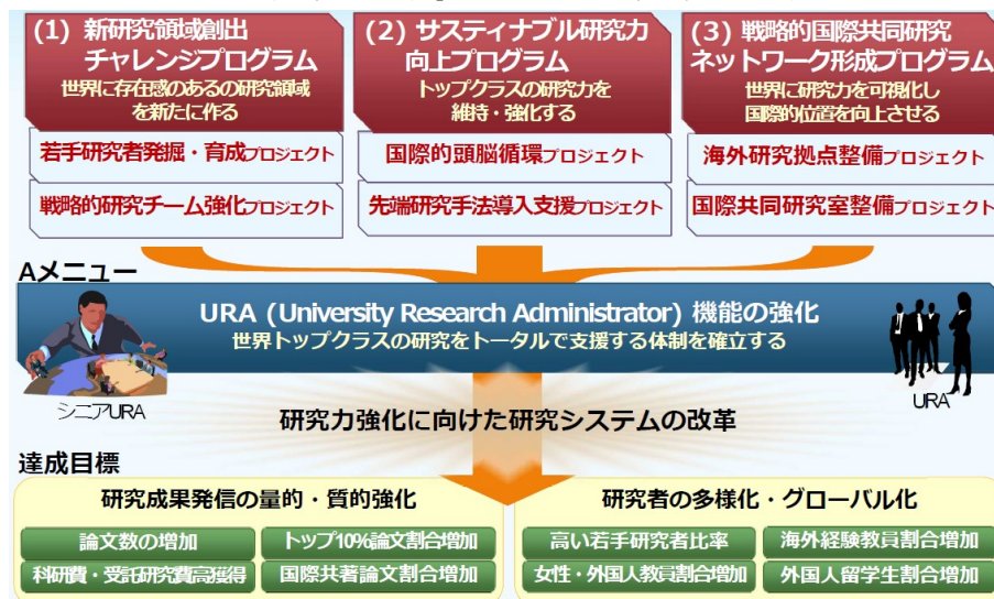
「研究大学強化促進事業」による研究力強化実現構想の概念図

「戦略的国际共同研究ネットワーク形成プログラム」として、研究のグローバル化を推進するため、フランスとアメリカに「海外サテライト研究室」を設置するとともに、アメリカ・フランス・カナダの学術交流協定校の研究者が主宰する「国際共同研究室」を本学内に設置し、国際的な研究ネットワークの拡充を進めている。これらの取組を通じて海外大学の研究者との間で国際共同研究を展開しており、事業を開始した平成 26 年度からこれまでに 51 報の論文発表や 63 件の学会発表等に繋がっている。